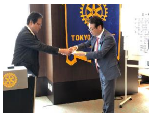
表彰式：会員増強賞