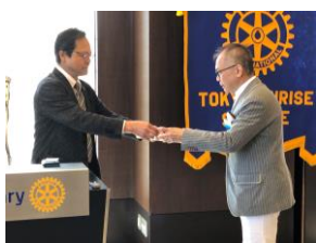
表彰式：会員増強賞

我々の様な会費を払ってのビジネスクラブとしての存在は価値が既存してきていることは事実なので、それ以外に興味を持ってもらえるように変えていく事をいつも考えています。価値がなくなれば脱会されてしまうので、そうならないように考えていかなければいけないと思っています。