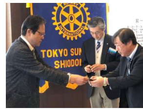
表彰式：ポールハリスフェロー