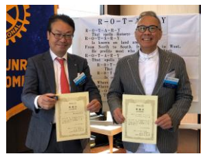
梅澤会員 アンドリュー会員