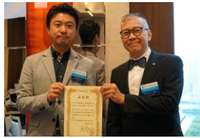
財団寄付3部門達成クラブ表彰