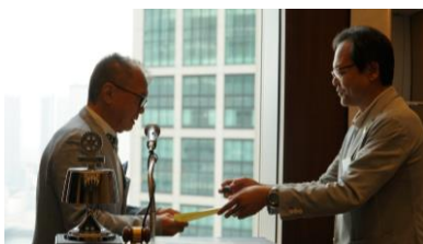
アンドリュー会長表彰式