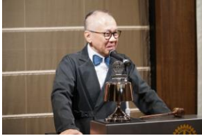
アト・ルー・ウオ会長