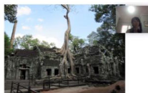
アンコールワット