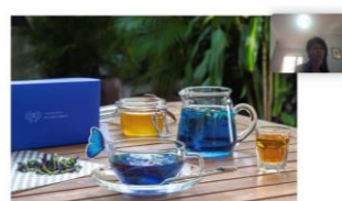
カンボジアのハーブティー ブルーバタフライ