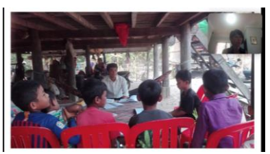
現在のカンボジアでの授業の様子