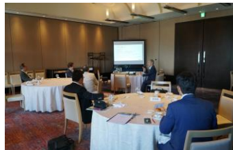
イニシエーションスピーチ