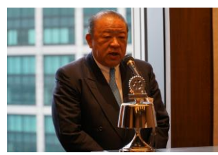
岩上ガバナー補佐