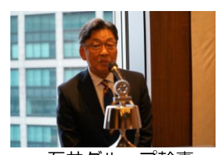
石井グループ幹事