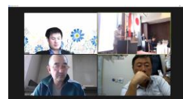
補助金専門家グループ(Cadre)

WHO are we? → Rotarians WHAT we do? → We train Rotarians to do GG's WHEN to help? → Anytime WHY we help? → To use your donations wisely HOW we can help? → Let us know what you need