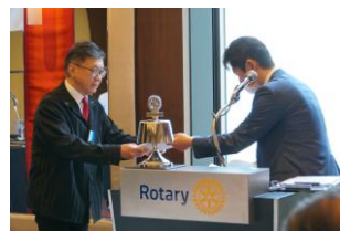
アットリユー・ウオ会員授与式