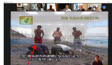
『アド街ック天国』に出演した時の映像