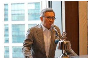
アド・リュウ・ウオ会員