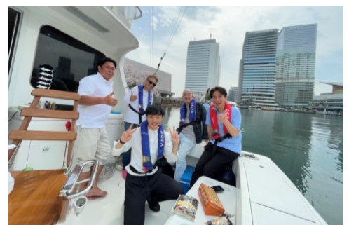
米山奨学生の許さんも 参加してくれました