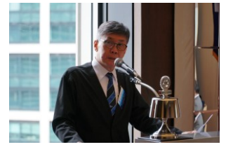
アド・リビュー・ウオ会員