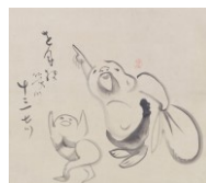
仙厓 指月布袋画賛