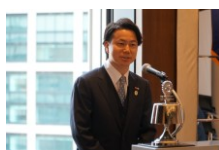
東京ビヅ ヨロ-ター-アクトクラブ 平子会長