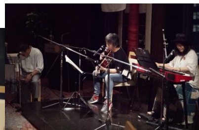
TORA with 梅ちゃん