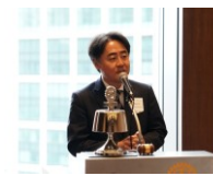
前田グループ幹事