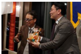
梅澤会長から娘さんへクリスマスプレゼント