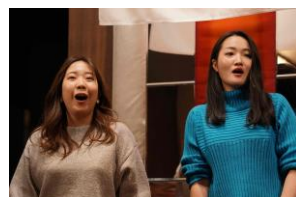
♪愛知副会長のゲストに『きよしこの夜』を歌って頂きました♪