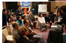
かなり間近でマジックを見ましたが仕掛けは分らず皆さん楽しんでいました！