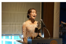
最後に『夢破れて』を歌って頂きました

今回帝国劇場が改修工事に入ってしまうので、とても寂しいですがまた、新しくなった帝国劇場に立てる事を楽しみにしています。