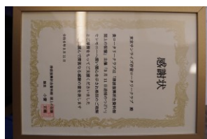
閉上の記憶からの感謝状