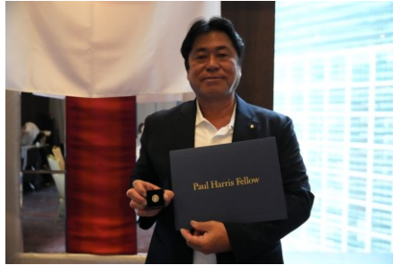
ポールハリスフェロー表彰