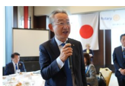
浜中正樹ガバナー補佐