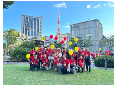
10月30日ポリオデーイベント